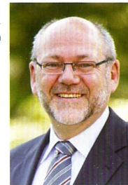
Bürgermeister Jost Egen

Als Schulträger ist die Stadt Preußisch Oldendorf jedoch verpflichtet, auf Veränderungen wie dem Bevölkerungsrückgang und der daraus folgenden geringeren Schülerzahl pro Klasse zu reagieren. Gleichzeitig soll die gute Bildungsqualität erhalten, in Teilen sogar verbessert werden. Hier bietet die neue Schulform bessere Voraussetzungen, um unsere Schüler und Schülerinnen vor Ort mit einer verlässlichen Unterrichtsqualität zu beschulen.